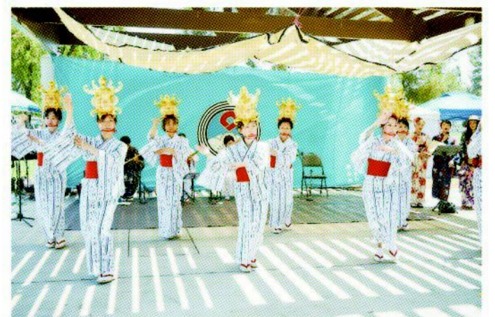
2025 Oshogatsu Matsuri in Little Tokyo – Yoheho Bushi