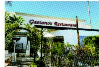
Gaetano's Restaurant 2731 Pacific Coast Hwy, Torrance, CA 90505

Ribs $26 はキャンティワインで柔らかく煮込んだショートトリブが、もちっとしたタリアテッレパスタと絡み合っていて、ビーフシチューとパスタが融合したような味わいのある一品。ワインの酸味が牛肉の濃厚な旨味を引き立て、重厚な味わいになっています。デザートからは2品。Nutella Bread Pudding $11 はプリアツシユにヌテラをたっぷり絡めて焼き上げたプディングで温かく濃厚です。Tiramisu $11 はマスカルポーネチーズとエスプレッソが織りなす軽やかな口当たりと深いコクが楽しめる締めめにぴったりのスイーツ。一人ランチからビジネス、友人との食事まで、幅広いシーンで頼れる王道のイタリアンレストランです。